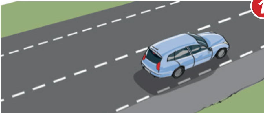
Landsväg med vägren på båda sidor.