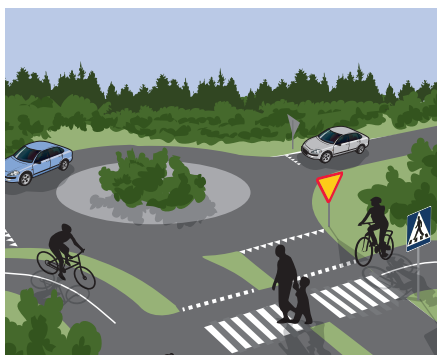
Cirkulationsplats, väjningsplikt, övergångsställe.