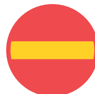
Förbud mot infart med fordon