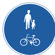
Gemensam gång- och cykelbana