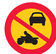
Förbud mot trafik med annat motor drivet fordon än moped klass 2