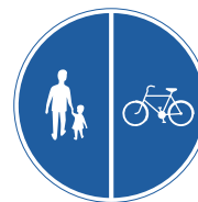
Gång- och cykelbana som är delad med en linje.