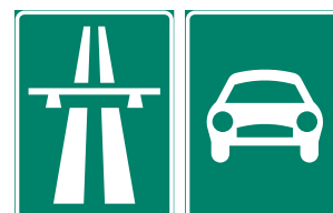
Motorväg och motortrafikled