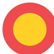
Förbud mot trafik med fordon